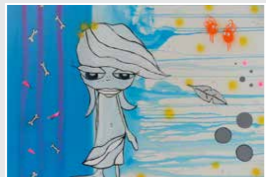
120 x 80 cm