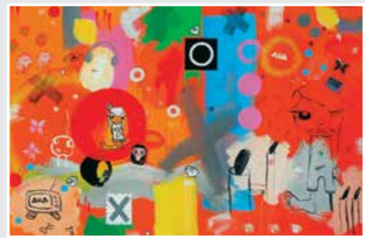
150 x 100 cm