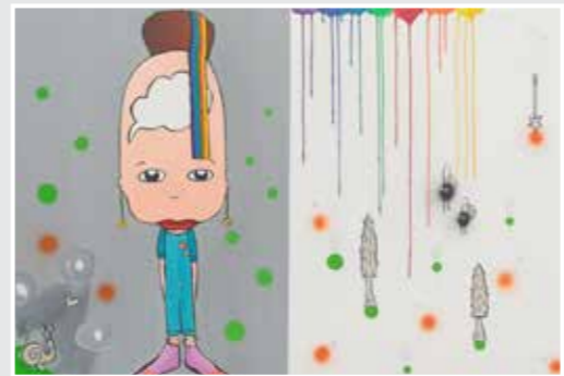
150 x 100 cm