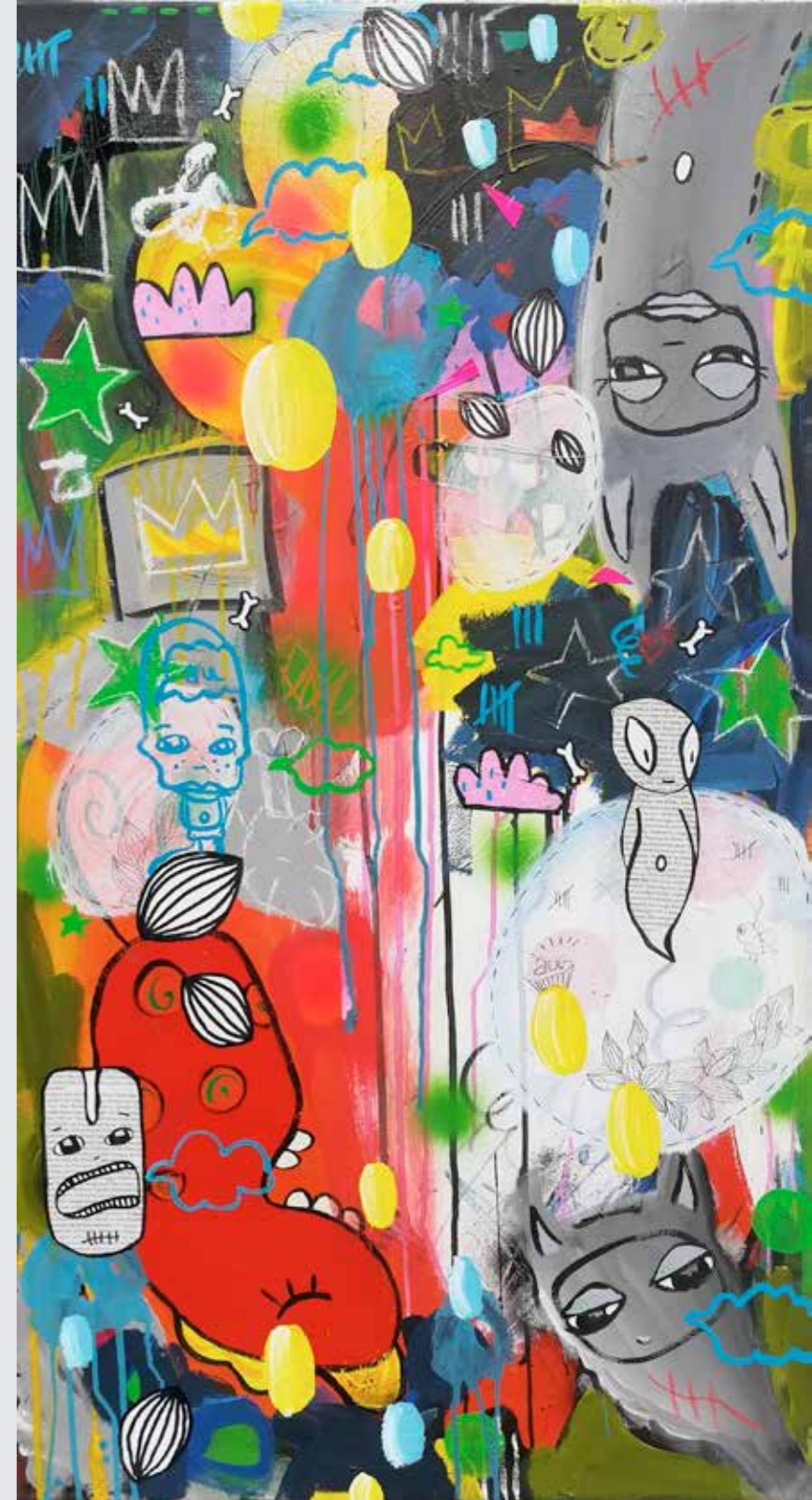
60 x 110 cm

Susanne Beucher paints and draws characters inbetween the areas of abstraction & figuration. She toys with humorous and supposedly simple forms of expression. Through use of acrylic paint, spray paint & elements of collage she works with detail and in layers on her seemingly innocent visuals that are populated by accentuated, adorable creatures. On a second glance the ambiguity of the abyssal & playful world of thought that the artist displays becomes apparent. The comic-like motives are taken out of it's context and are worked into new visual compositions which bears resemblance to "Streetart". Finds & symbols from everyday life are developed into a complex vocabulary of her own, which emotionally and energetically aims for the core of those things. Beucher uses painting and color as lifeblood; as her tools in the fight for survival in the steadily complicating world of day to day life. The artist fabricates a purposefully subconscious and blunt artistic experience, which works independent of age, gender and culture.