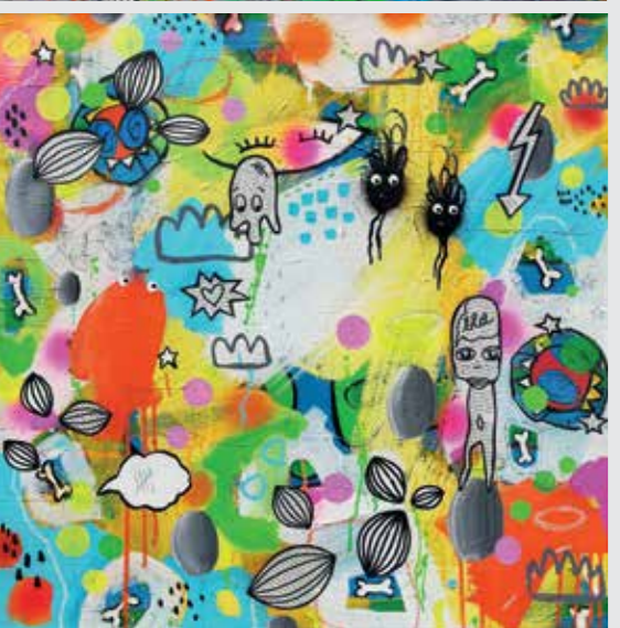
70 x 70 cm