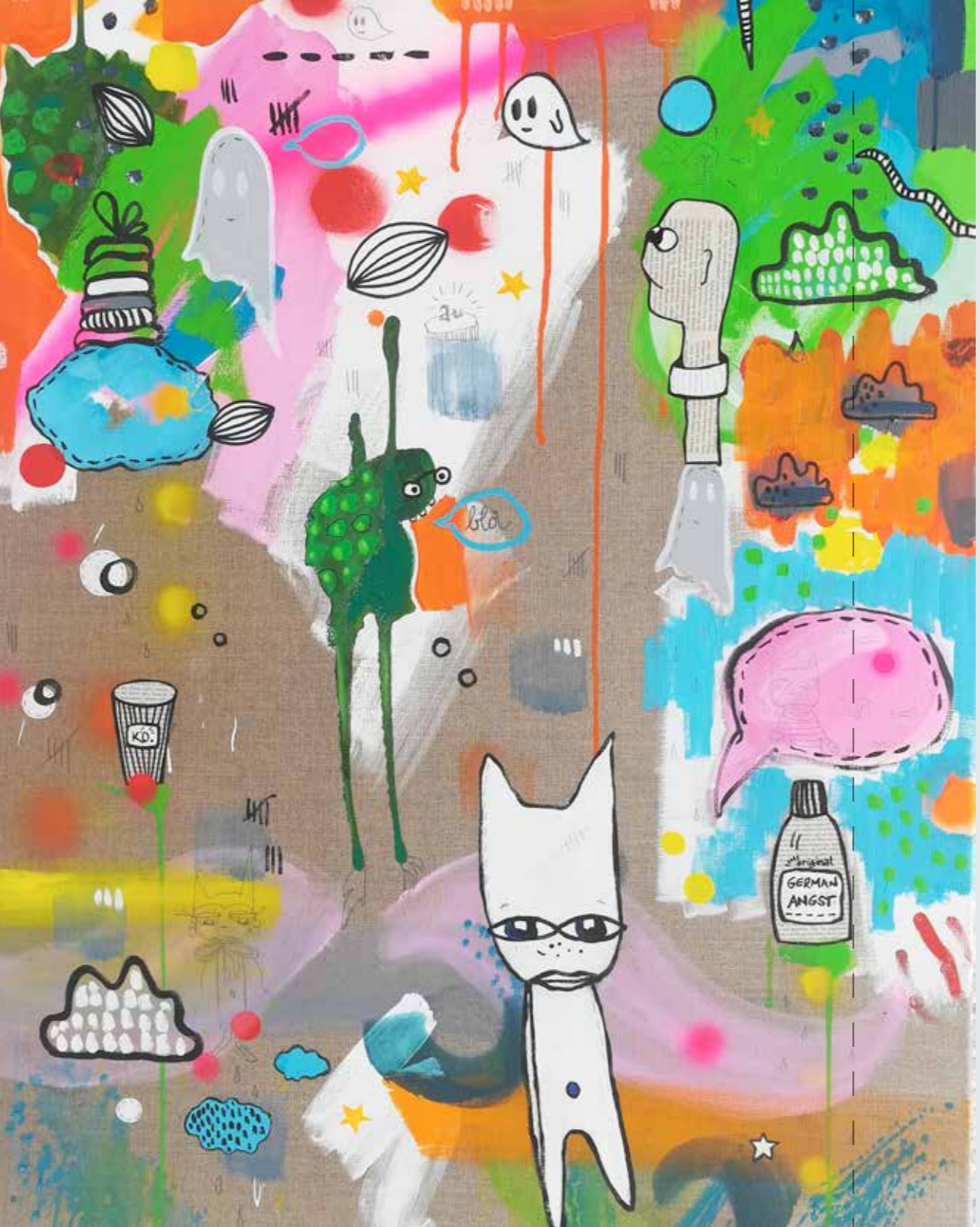
80 x 100 cm