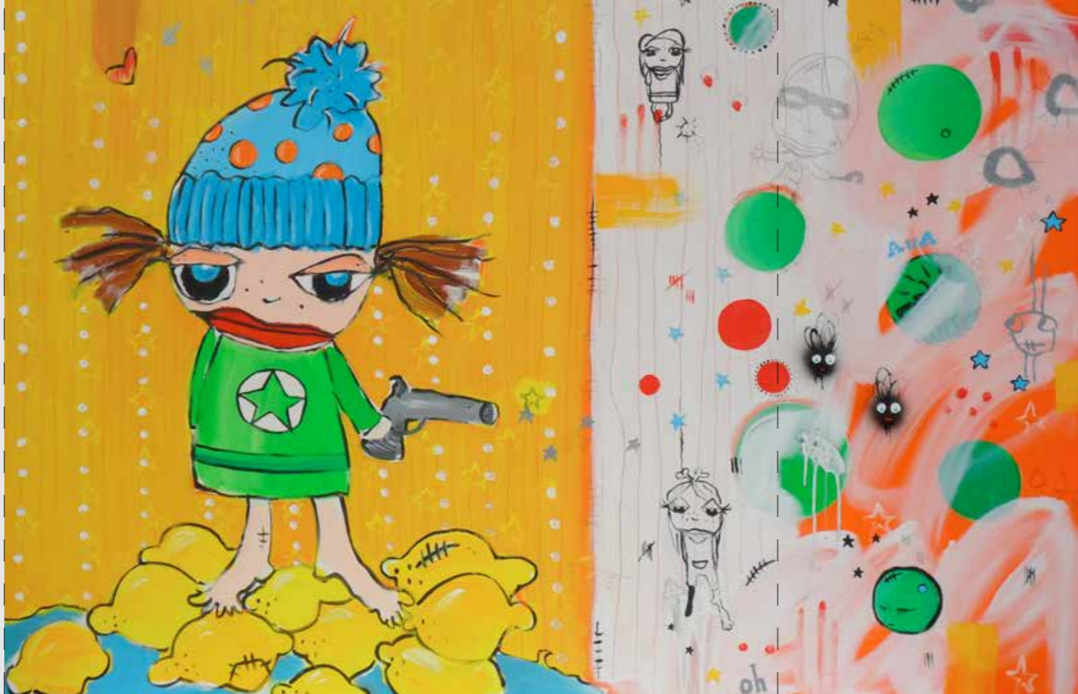
150 x 100 cm

Susanne Beucher malt und zeichnet Charaktere im Spannungsfeld zwischen Abstraktion & Figuration. Sie spielt humorvoll mit scheinbar einfachen Ausdrucksformen. Mit Acrylfarbe, Sprühlack & Collageelementen erarbeitet sie detailreich aufgeschichtet ihre zunächst unschuldig wirkenden Bildwelten, die von betont niedlichen Wesen bevölkert werden. Beim zweiten Hinschauen erschließen sich Doppeldeutigkeiten, hinter denen sich die abgründige & spielerische Gedankenwelt der Künstlerin offenbart. Die comicartigen Motive sind aus ihrem Kontext entnommen und werden zu neuen Bildkompositionen verarbeitet, die eine Nähe zur „Streetart“ aufweisen. Aus Fundstücken & Symbolen des Alltags entwickelt sie ein eigenes komplexes Vokabular, das emotional und energiegeladen auf das Wesentliche der Dinge zielt. Beucher nutzt Malerei und Farbe als Lebenselixier; als ihr Werkzeug im Überlebenskampf in der immer komplexer werdenden Welt des Alltags. Die Künstlerin zielt auf das Unbewußte und erzeugt ein direktes Kunst-erlebnis, das unabhängig von Alter, Geschlecht & Kulturform funktioniert.