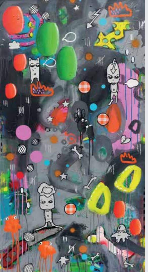
70 x 130 cm