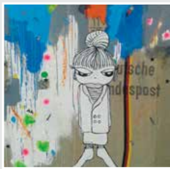
150 x 100 cm